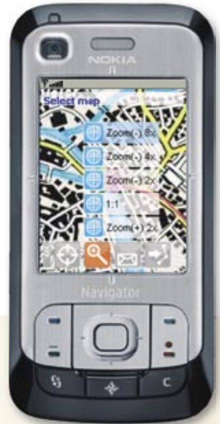
Abbildung 1: Karten Overlay Menü

für Outdoor-Aktivisten jeglicher Art und kann im Falle eines Unfalls als Notrufsystem verwendet werden.