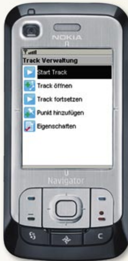
Abbildung 4: Trackmanagement