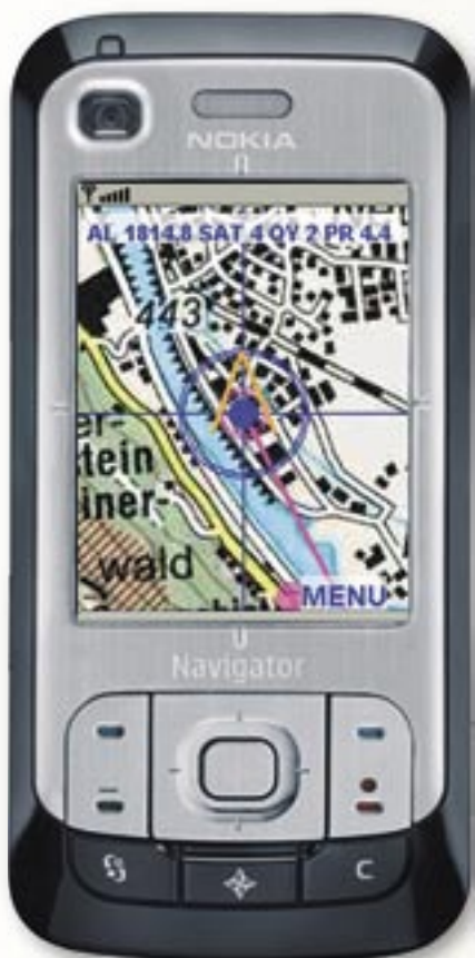
Abbildung 3: Positionsbestimmung

Mit der Tastensteuerung von Ape@Map verhält es sich ähnlich, da auch hier keine Standardisierung vorliegt.